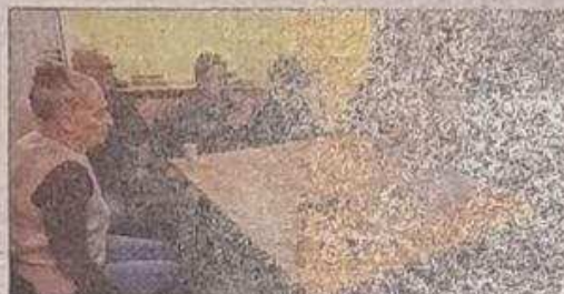
La réalité virtuelle a permis aux participants de vivre le temps d'une séance.

Le CCAS de la Ville de Yutz, en collaboration avec la DSI (Direction de la solidarité et de l'emploi), a mis en place des ateliers d'hypnose collective et de réalité virtuelle pour les seniors.